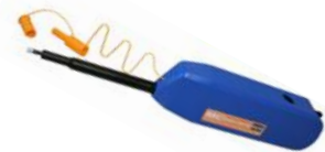
IBC-M250 für die Steckereinigung direkt im Panel (2.5mm PC/APC inkl. E2000)