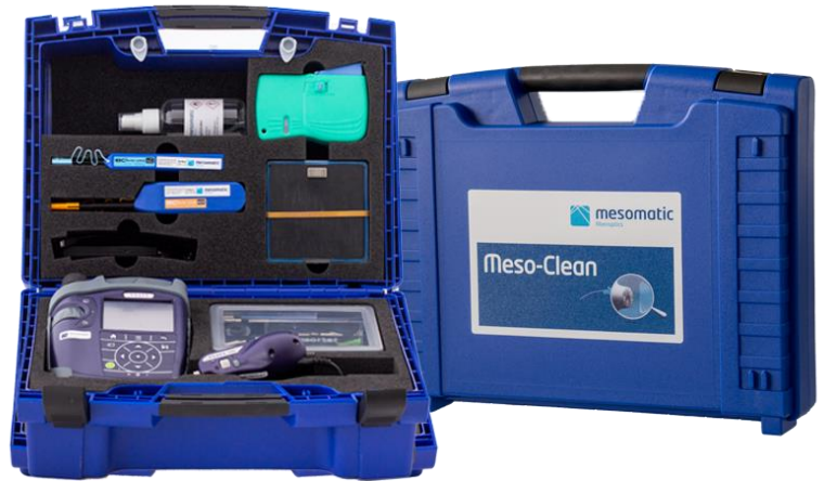
Artikel Nr. 34770