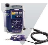
Handmonitor HD4 / OLP Integriertes Patchkabel-Mikroskop Panelsonde P5000i