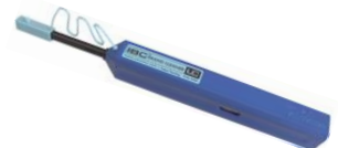
IBC-1.25 für die Steckereinigung direkt im Panel (1.25mm PC/APC)